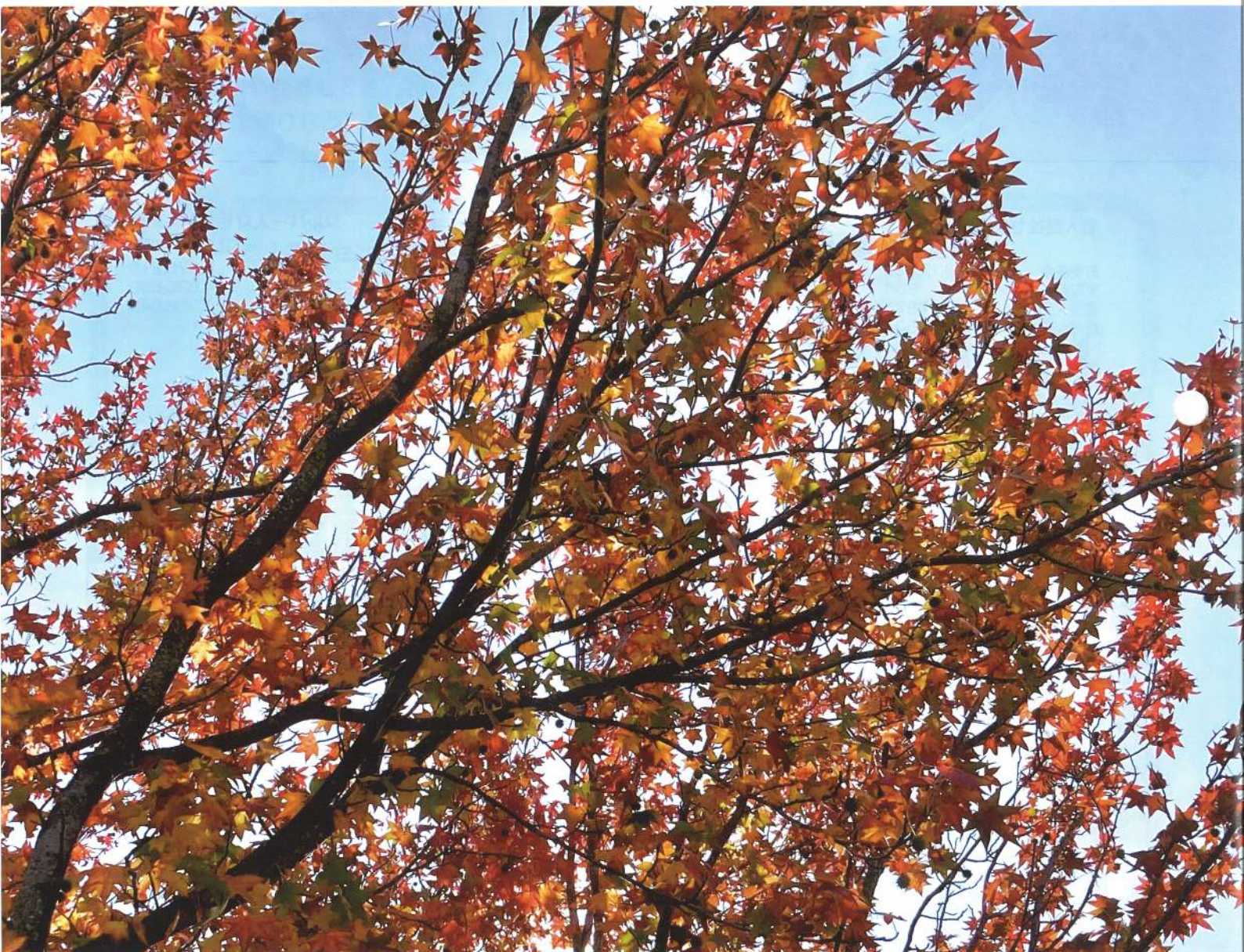
「鈴掛の木」