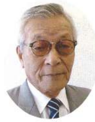
松茂町社会福祉協議会